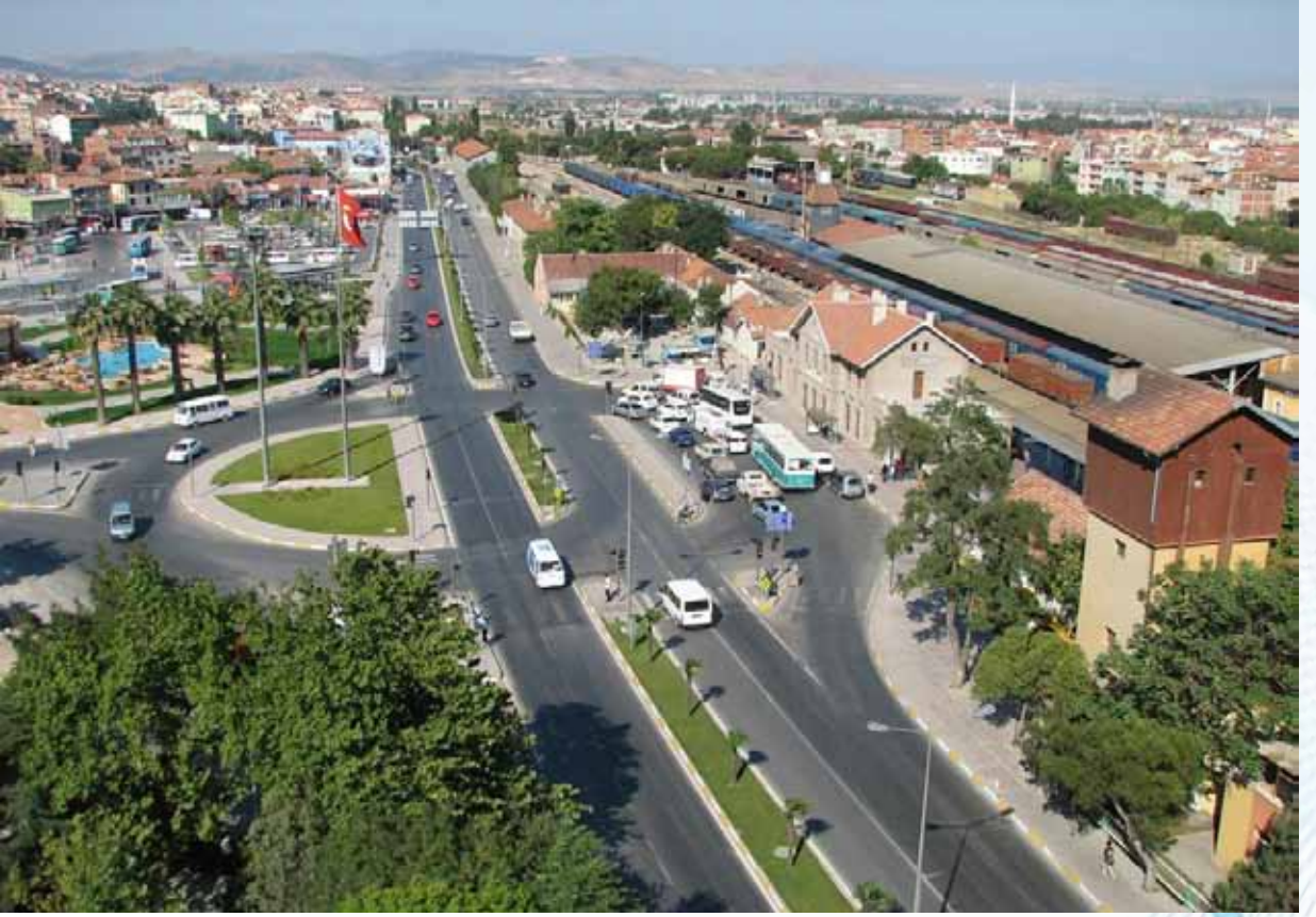
Tablo 11: 2011 yılı Balıkesir ilçe nüfusları