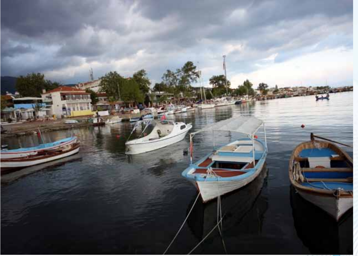
Tablo 13: 2011 yılı Çanakkale ilçe nüfusları