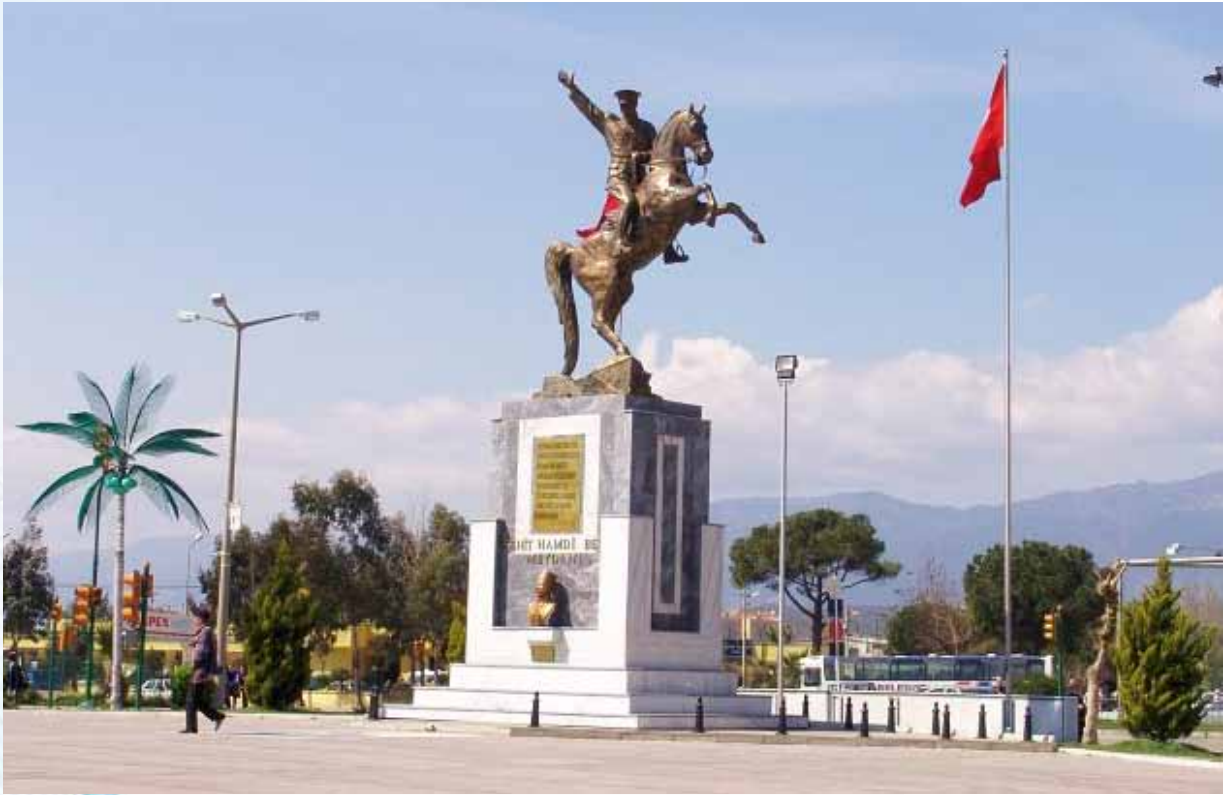
Tablo 12: 2010 yılı Balıkesir ilçe nüfusları